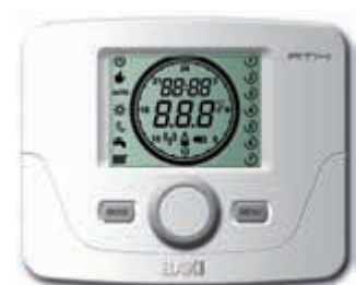
Termostato modulante programable

También existe la posibilidad de crear un pack de alta eficiencia energética, combinando la caldera con la energía solar térmica, consiguiendo así un ahorro superior en la factura energética.