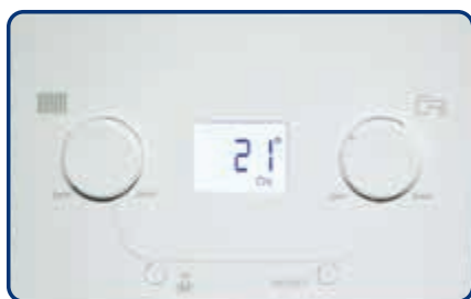
Cuadro de control

Además, la pantalla retroiluminada que integra permite ver el estado de la caldera y los principales datos de funcionamiento como temperaturas o posibles códigos de anomalía.